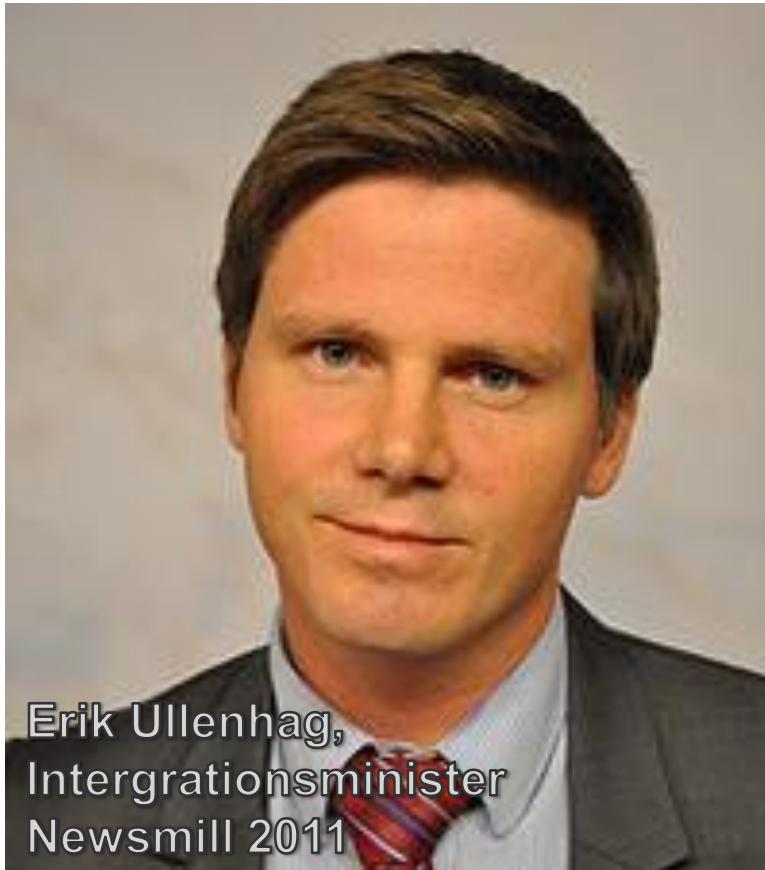
Erik Ullenhag, Intergrationsminister Newsmill 2011

“Svensk integrationspolitik har brottats med två huvudproblem. För det första har politiken präglats av alldeles för mycket av omhändertagande. Flyktingar och invandrare har bemötts som svaga individer som ofta har fått frågan vad de ska ha för bidrag snarare än vad de kan bidra med. För det andra har politiken misslyckats med att se att de som har kommit är olika - politiken har inte varit tillräckligt individuellt anpassad utan har i stället formats utifrån att alla som invandrar har haft behov av samma stöd. Det har resulterat i att det har tagit alldeles för lång tid för många nyanlända att komma in på arbetsmarknaden. “